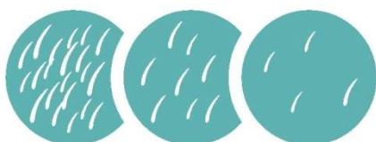
Abb.: Reduzierungs- phasen des Haarwachstums

Selbstverständlich ist das Herausziehen der Haare mittels der Zuckerpaste nicht völlig schmerzfrei. Dennoch ist es gut auszuhalten, da ganze Areale mit einem schnellen Zug enthaart werden und für die wochenlang glatte Haut lohnt es sich auf jeden Fall.